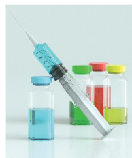
СХЕМА ВАКЦИНАЦИИ ОТ ДИФТЕРИИ, КОКЛЮША, СТОЛБНЯКА СТАНДАРТНАЯ: